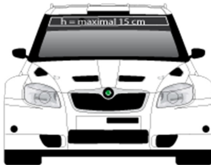
FRONTSCHIEBE LT. ARTIKEL 18.7.4 national